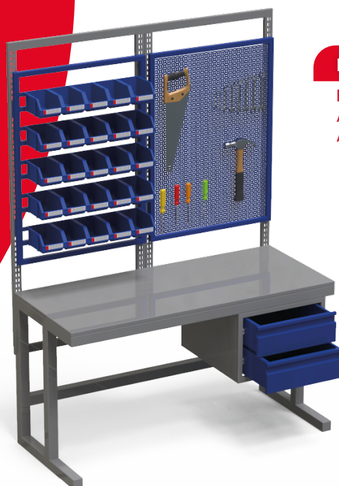
Puesto Tipo A